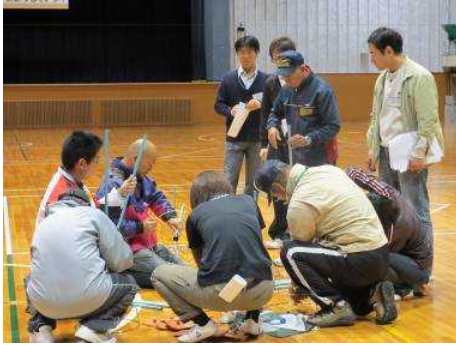
ボランティアさんと一緒に会場準備