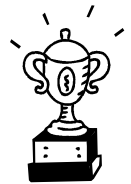
司会もプレイも全力投球！