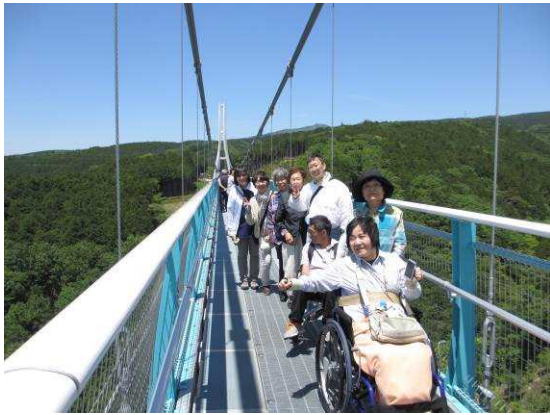
復路は楽しみながら、並んでパチリ！

総勢 21 名がリフト付きバスで川崎を出発、足柄SAでのトイレ休憩を入れ、約2時間30分で歩行者専用日本最長の吊り橋「三島スカイウォーク」に到着。長さ400m、高さ70.6m、歩道幅1.6mがあり、車いすでも渡る事ができます。前日の雨のお陰で空気が澄み、眺めは最高なのですが、中央に近づくにつれて、あ〜揺れるうう…。警備の方の話しによると「今日は結構揺れる」だそうで、充分楽しむことができました！ 昼食を「ZU WORLD みんなのハワイアンズ」でとったあとは、お楽しみのお土産大会。大満足の日、ご参加の皆さんお疲れ様でし