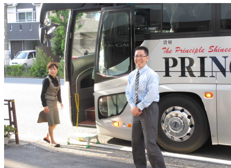
優しい運転手さんと楽しいガイドさん、お世話になりました

久しぶりに日帰り旅行に参加させて頂き、皆さんの顔を拝見することが出来ました。何年ものブランクがあるのにその間があたかもなかったかのように感じたのは不思議です。皆さんの普段の行いの御蔭様で富士山の眺めは最高。自己紹介の好きなタレントの話からカラオケに。バスは一瞬にして居酒屋に。ハワイアンズでは、ロゴガールの大きなフィギュアが私達