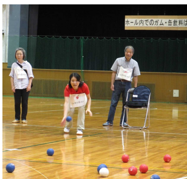
頑張るボランティアさんチーム！