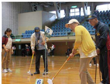
まっすぐ転がって～！（グランドゴルフ）