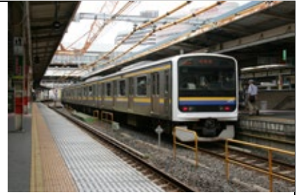
千葉駅に停車中の209系(房総版)の電車。209系(房総版)の運転室付きの車内には窓と直角に並べられたいすがあります。

209系(房総版)は内房線だけでなく、総武線の千葉-銚子間や成田-我孫子間を除く成田線、鹿島・東金・外房の各線の全線も走り回る働き者です。