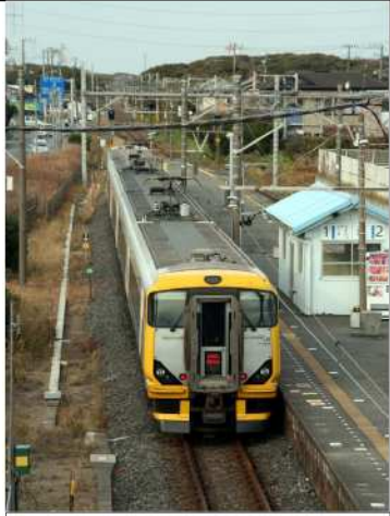
大貫駅に停車中の特急「さざなみ」

富津市の西側には市内ただ一つの鉄道である JR東日本の内房線がほぼ南北 に通っています。駅は北から青堀、大貫、佐貫町、上総湊、竹岡、浜金谷の 6駅です。これらの駅には千葉と館山・安房鴨川方面との間を結ぶ普通列車が 発着し、一部の駅には東京-館山間の特急「さざなみ」も停車します。