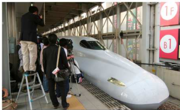
新車に集まる各分野のジャーナリストたち:博多駅

新聞やテレビ、ラジオ、雑誌など、マスメディアの世界ではジャーナリストと呼ばれる人たちが数多く活動しています。