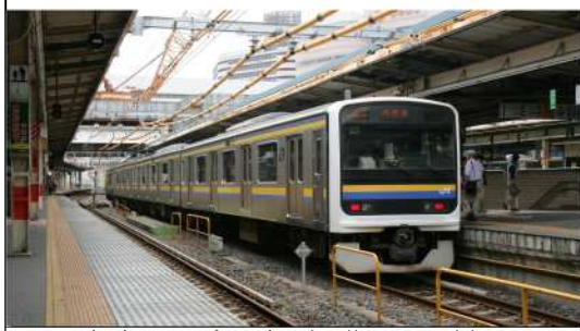
千葉駅で出発を待つ内房線の普通列車

ところで、内房線の正式な起点と終点とをご存じでしょうか。 終点は安房鴨川駅で想像が付くと思いますが、実は正式な起点は千葉駅では