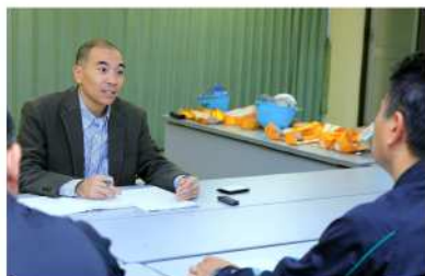
インタビュー取材中の筆者

【プロフィール】月刊「鉄道ファン」編集部などを経て、2000年から鉄道ジャーナリストになる。『ココがスゴい新幹線の技術』(誠文堂新光社)、ほか著書多数。中央公民館「鉄道文化歴史講座」講師